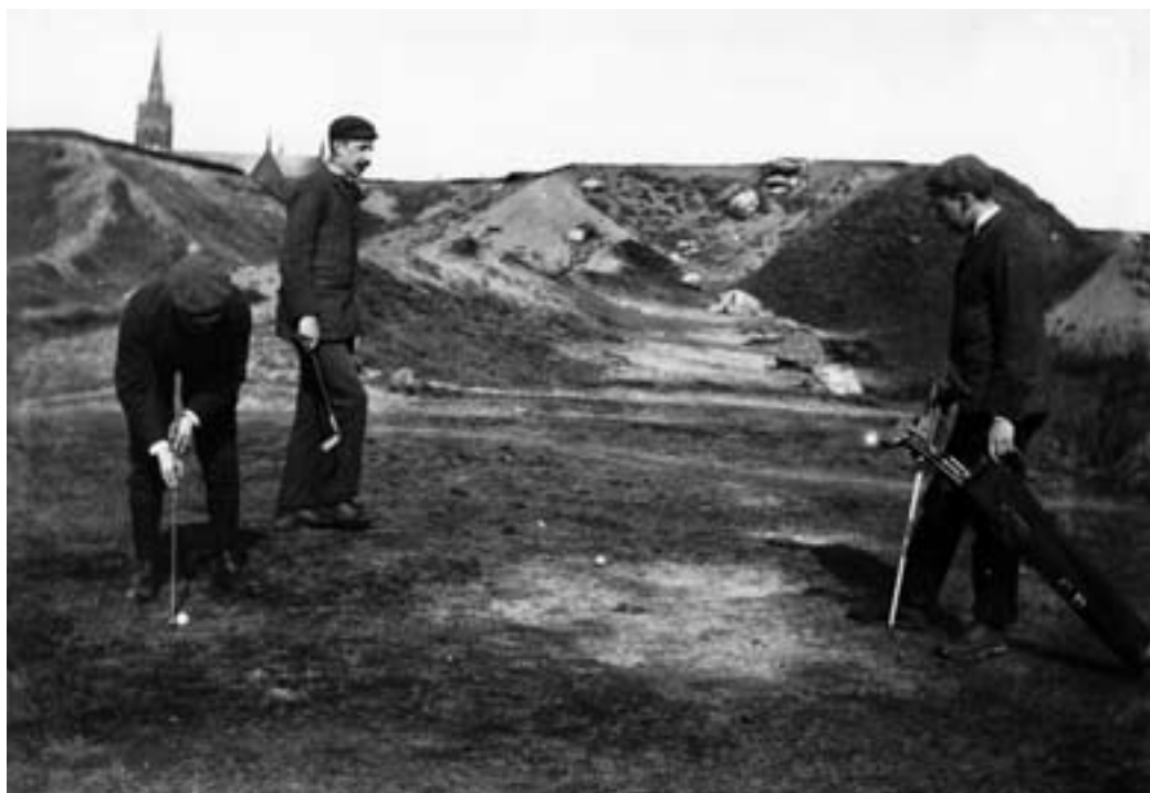
En av Sveriges första golfbilder från Lundbyhamnen med Lundby kyrka i bakgrunden.

En ny tid har brutit in. Med den en annan uppfattning. Framför tennisbanorna, bredvid det gamla värdshuset har en golfbana anlagts. Spelklar i år. Därmed går den anrika bador-