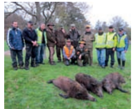
Jägare, medlemmar och personal.