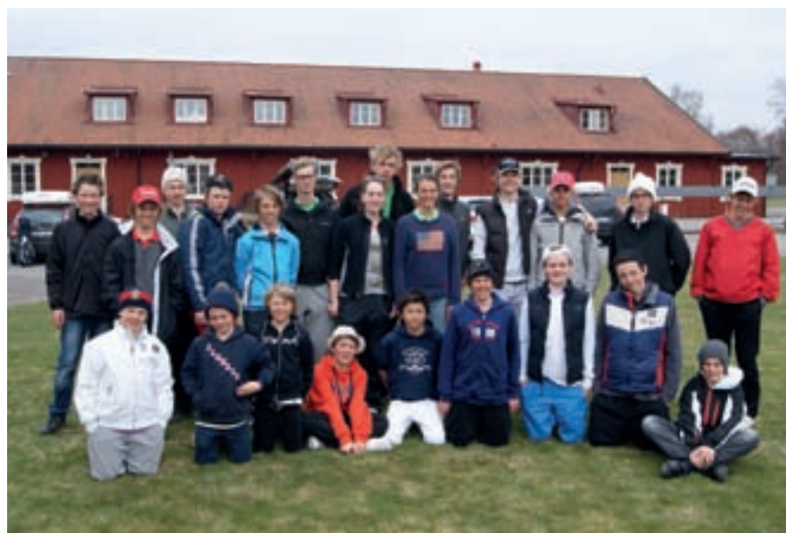
Juniorlägrets alla deltagare.