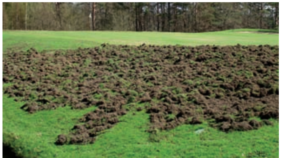
Hål 3 Långa banan en morgon i maj.

Området jagades av med gott resultat – 3