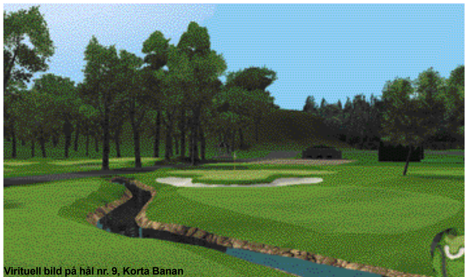
Viruell bild på hål nr. 9, Korta Banan